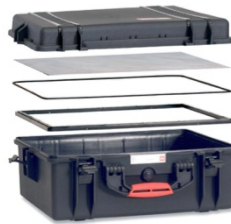
[ HPRCPF-004-01 ]