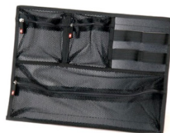
[ HPRCORG-001-01 ]

[ México D.F ] 55.8851.8726 - 55.8851.8725 [ Querétaro ] 442.234.1610 - 442.234.1338 www.harderback.com